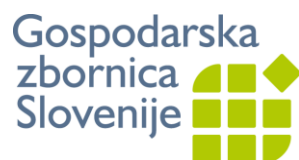
Metal Processing Industry Association