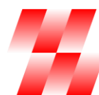
ZEPSR Association of Electrotechnical Industry of the Slovak Republic